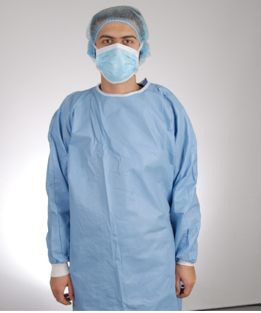
renk / color