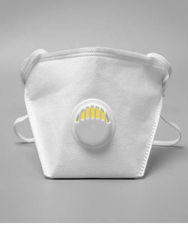
renk / color