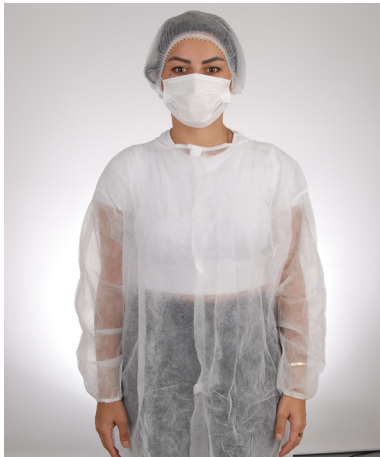
renk / color